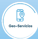
Imagen de pantalla de inicio referencial para fines ilustrativos. Puede ser configurada de acuerdo con opciones otorgadas por la app.

(**) La visualización de cámaras en vivo o imágenes es un Servicio Adicional.